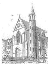
Parochie O.L.V. Onbevlekt Ontvangen Zenderen

Betreft: bijwerken c.q. vernieuwen adressenlijst parochiële werkgroepen.